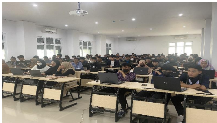
Gambar 1. Peserta Pelatihan

Aplikasi Mendeley, yang meliputi Mendeley Desktop, Mendeley Web Reference Manager, dan Mendeley, diperkenalkan pertama kali selama pelatihan. Versi desktop Mendeley digunakan untuk demonstrasi dalam pelatihan ini. Setelah itu, peserta diperlihatkan bagaimana cara mengatur Mendeley Desktop dan membuat akun.