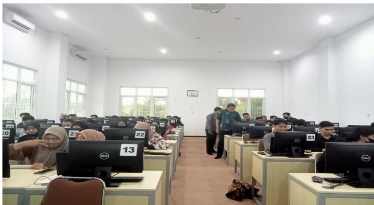
Gambar 6. Diskusi dan Tanya Jawab

Langkah narasumber adalah langkah berikutnya. Mereka menjelaskan dan menunjukkan cara menggunakan alat dan fitur dalam tampilan Mendeley, seperti cara menambahkan artikel secara manual atau otomatis dengan mengimpor file ke bibliografi. Para peserta kemudian diinstruksikan tentang cara menginstall Add-on untuk menghubungkan aplikasi Mendeley ke Microsoft Word. Terakhir, sumber, terlepas dari bagaimana kutipan dimasukkan dalam tulisan ilmiah atau dihasilkan secara otomatis.