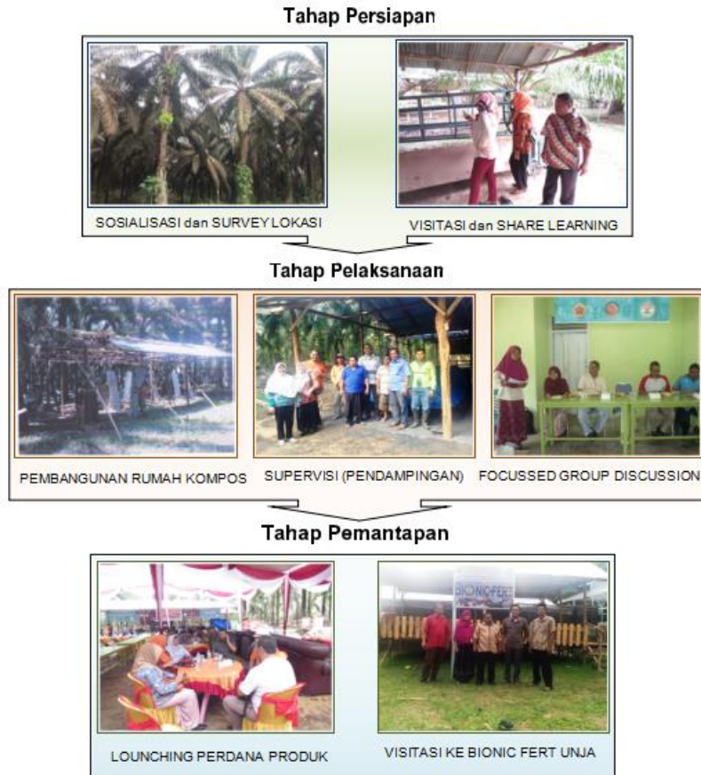
Gambar 2. Rangkaian Tahapan Kegiatan