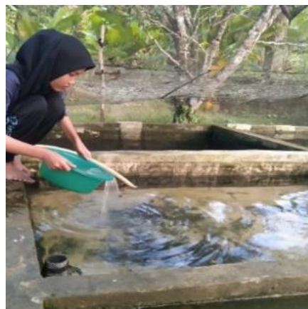
Gambar 2. Penambahan garam untuk menghasilkan air bersalinitas 4 ppt

2. Kegiatan Pendampingan Teknis dan Demplot Kegiatan pendampingan teknis dilakukan dengan penempatan mahasiswa Praktek Lapang. Kolam demplot yang digunakan sebanyak 2-unit yang diisi dengan air media pemeliharaan ikan dengan salinitas 0 (K 0 ) dan salinitas 4 ppt (K 1 ). Penambahan garam dilakukan untuk menghasilkan air media bersalinitas 4 ppt. Selanjutnya dilakukan penebaran ikan lele berukuran 8±0,5 cm.