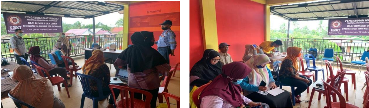
Gambar 2. Pelaksanaan Pengabdian

(KPP) tempat wajib pajak terdaftar melalui email. Terdapat beberapa peserta yang telah memiliki e-fin, sehingga pelatihan pengisian SPT tahunan dilanjutkan dengan memakai NPWP dan efin salah satu peserta.